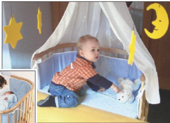
Ganz nah, aber doch im jeweils eigenen Bett schlafen Mutter und Neugeborenes mit dem „Babybay“-Bett von Tobì. Dem Bettchen erwachsene Kinder können es als Spielnude, Bank oder Schreibtisch nutzen.

Da der Nachwuchs noch weiter auf sich warten ließ, blieb Zeit zur Reklamation. Nach einem Telefonat beim Hersteller des Bettchens, der in Alling bei München ansässigen Firma Tobì, ging alles rasch: Ein neues Bett wurde – im Tausch gegen